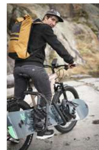
Le « Weekend 27 Picture » de Moustache Bikes est équipé et prêt pour l'aventure.