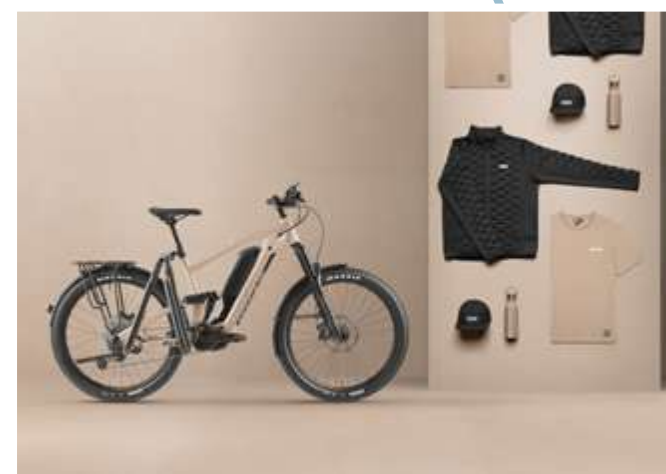
Moustache, le fabricant de vélos 100 % électriques et Picture Organic Clothing ont conçus de nouveaux cycles et vêtements techniques.