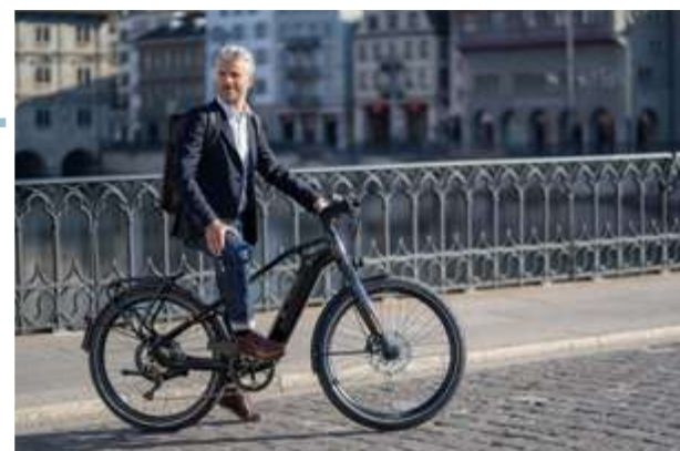
E-Bike « Flyer », vendu chez Holland Bikes.

Les marques spécialisées proposent toutes les pièces du parfait cycliste urbain : Du sac à dos, en passant par le messenger bag et sacoche de vélo, sans oublier les vêtements imperméables, le brassard réfléchissant pour être vu la nuit ou encore le miroir aérodynamique pour les triathlètes.