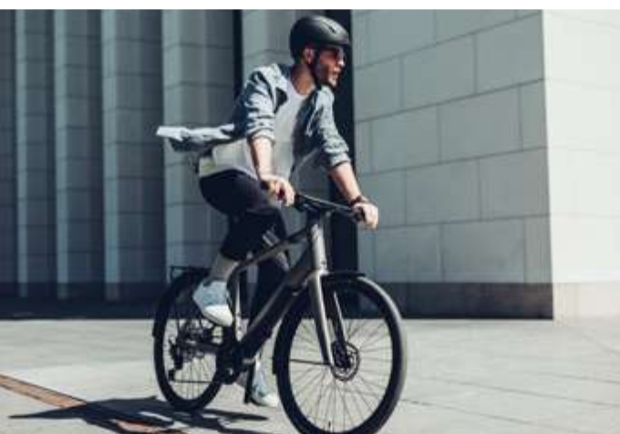
Vélo électrique « CommuterON » de Canyon.

Le vent dans le dos, en ligne droite et sans obstacle. Voilà comment on peut qualifier la trajectoire du marché du vélo. Près de 2,7 millions de vélos neufs ont été vendus en 2020.