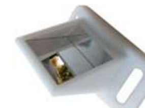
Vizzzz, le miroir aérodynamique rend les cyclistes et les triathlètes plus performants, sur T'enrev.com.