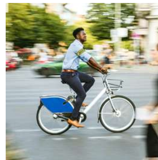
Brassard rétro réfléchissant ajustable « Easy Fit » pour assurer une visibilité à 360°, chez B Reflective.