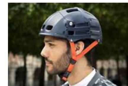
Casque pliable Piixi Fit Overade, disponible chez Holland Bikes.

Les marques spécialisées proposent toutes les pièces du parfait cycliste urbain : Du sac à dos, en passant par le messenger bag et sacoche de vélo, sans oublier les vêtements imperméables, le brassard réfléchissant pour être vu la nuit ou encore le miroir aérodynamique pour les triathlètes.