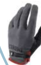
Gants spécialement conçus pour les cyclistes, chez Chrome.