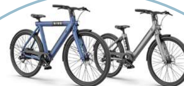
Bird commercialise son nouveau vélo électrique, « Le Bird Bike ».