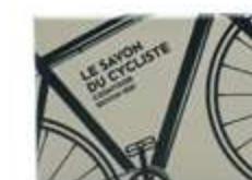
« Savon du cycliste » chez Cosmydor.