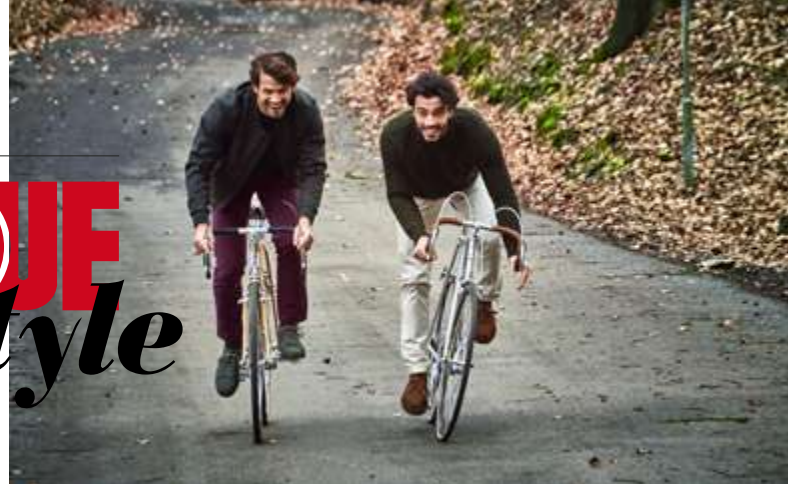
Mr Marvis a lancé la collection des « Coolerdays », des pantalons chauds et stretch : idéal pour l'automne.