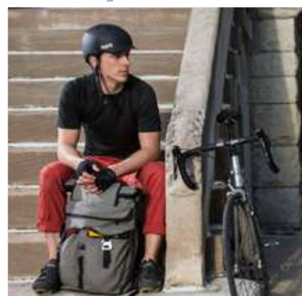
Casque Watts EPS Bern, vendu chez Holland Bikes.

Avec plus de 500 000 cycles écoulés en 2020, les vélos à assistance électrique représentent désormais un vélo sur cinq vendu en France. Et ce sont notamment les VTT électriques qui connaissent un grand succès !