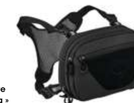
Pratique la pochette « Archeon Chest Rig » d'Osprey qui se fixe sur le buste.