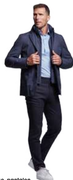
Ensemble chemise, pantalon, blazer imperméable chez Wolbe Paris.