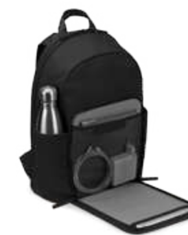
Sac à dos multi-usages « Aalborg » chez Kapten&Son.